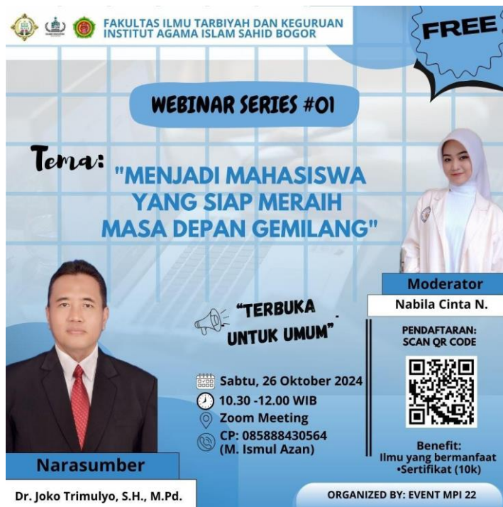
Gambar 1. Flyer kegiatan untuk media sosial