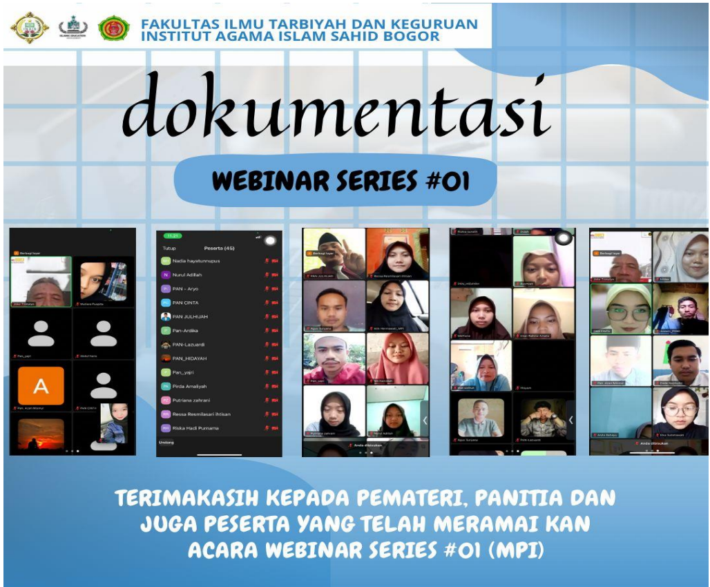
Gambar 3. Dokumentasi kegiatan webinar

Secara keseluruhan, webinar ini memberikan kontribusi nyata dalam meningkatkan kesadaran, motivasi, dan kemampuan mahasiswa dalam merencanakan masa depan akademik dan profesional mereka. Temuan tersebut menunjukkan bahwa model pengabdian berbasis pembelajaran daring dapat menjadi alternatif strategis untuk memperkuat kompetensi mahasiswa secara berkelanjutan. Dengan demikian, pelaksanaan webinar tidak hanya memberikan pemahaman konseptual, tetapi juga mendorong mahasiswa untuk mengembangkan keterampilan praktis, berpikir kritis, serta membangun sikap proaktif dalam menghadapi peluang dan tantangan di masa depan.